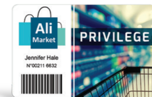
Cartes de fidélité