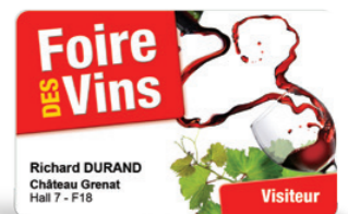
Invitations à vos événements