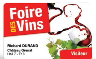
Invitations à vos événements