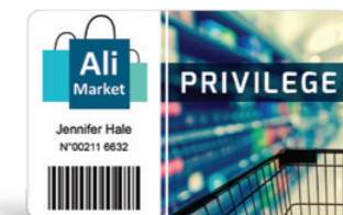
Cartes de fidélité